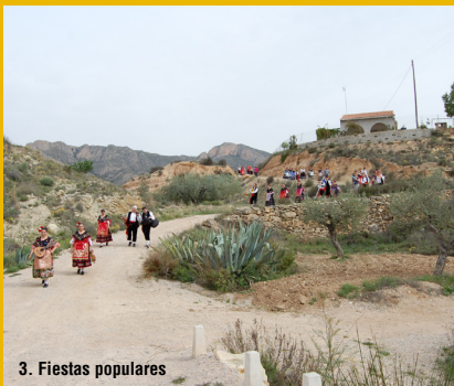
3. Fiestas populares