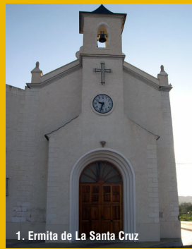
1. Ermita de La Santa Cruz