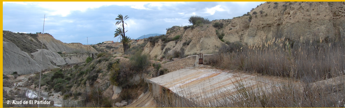
2. Azud de El Partidor