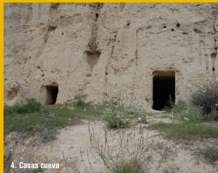
4. Casas cueva